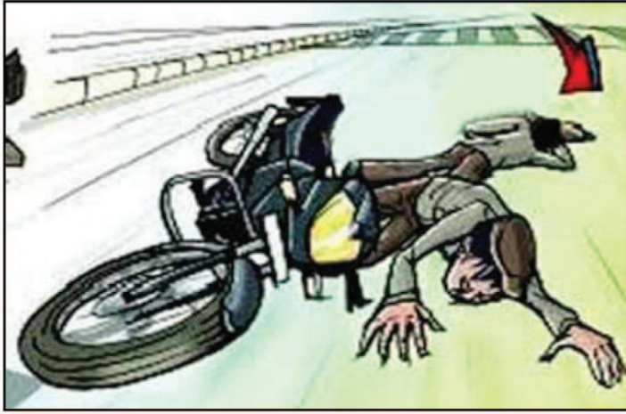
रहे आरोपी चालक ने तेजी एवं लापरवाही से एक युवक को टक्कर मारकर गंभीर रूप से घायल कर

मुरैना। जिले के बागचीनी थाना अंतर्गत सड़क किनारे जा रहे एक व्यक्ति को ईंट से भरे ट्रैक्टर ट्रॉली के चालक ने टक्कर मार कर गंभीर रूप से घायल कर दिया। इसके पश्चात आरोपी ट्रैक्टर चालक उसे जिला अस्पताल ले गया और प्राथमिक उपचार के बाद उसे ग्वालियर रेफर कर दिया। इधर घायल के परिजनों ने आरोपी पर घायल युवक का अपहरण करने का आरोप लगाया। इसके बाद यह मामला बागचीनी थाने पहुंच गया है। पुलिस द्वारा मामले की जांच की जा रही है। बताया जाता है कि गुरुवार की सुबह जौरा की ओर से ईंट से भरी ट्रैक्टर ट्रॉली लेकर जा