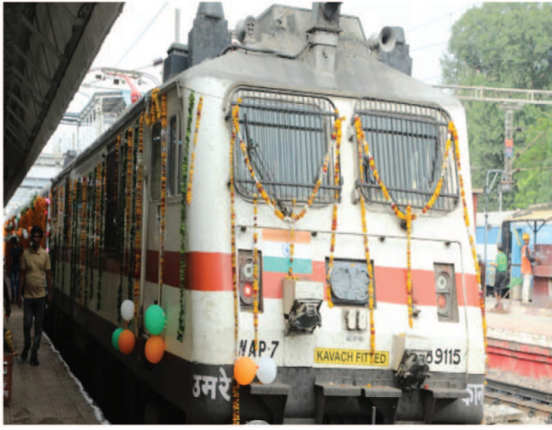
ग्वालियर नगर संवाददाता

ग्वालियर। ग्वालियर-चंबल अंचल को भारत सरकार के माध्यम से एक बड़ी रेल सुविधा उपलब्ध हुई है। अंचल के लोग अब ग्वालियर से सीधे बंगलोर रेल मार्ग से पहुंच सकते हैं।