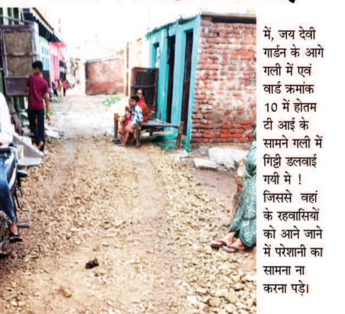
में, जय देवी गार्डन के आगे गली में एवं वार्ड क्रमांक 10 में होतम टी आई के सामने गली में गिटी डलवाई गयी है ! जिससे वहां के रहवासियों को आने जाने में परेशानी का सामना ना करना पड़े।