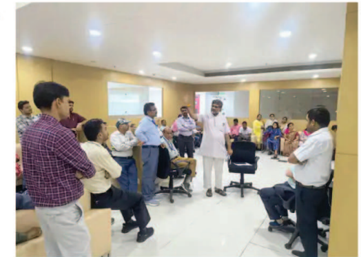
का राजपत्र में प्रकाशन करने के बाद सामान्य प्रशासन विभाग ने नए पदोन्नति नियमों को लेकर सभी विभागीय अफसरों की मीटिंग बुलाई है। जीएडी द्वारा बुलाई गई बैठक में मुख्य सचिव अनुराग जैन भी मौजूद रहेंगे। मोहन कैबिनेट द्वारा लोक सेवा पदोन्नति नियम 2025 को मंजूरी 17 जून को दी गई। इसके बाद सामान्य प्रशासन विभाग ने इसके नियम जारी किए हैं। बैठक में मुख्य सचिव, अपर मुख्य सचिव जीएडी के अलावा सभी

भोपाल। नए पदोन्नति नियमों को लेकर सामान्य प्रशासन विभाग (जीएडी) आज सभी विभागों के साथ बैठक करेगा। इस बैठक में जीएडी अफसर पदोन्नति नियमों के मुताबिक विभागों की विभागीय पदोन्नति समितियों का गठन कर पहली बैठक जल्द से जल्द बुलाए जाने के निर्देश देंगे। दूसरी ओर नए पदोन्नति नियमों के विरोध में सामान्य वर्ग, पिछड़ा वर्ग, अल्पसंख्यक वर्ग के अधिकारियों कर्मचारियों द्वारा आज मंत्रालय में लंच के दौरान प्रदर्शन किया जाएगा। इसको लेकर मंत्रालय सेवा अधिकारी कर्मचारी संघ ने मुख्य सचिव, एसीएस जीएडी और मंत्रालय के सुरक्षा अधिकारी को आंदोलन का नोटिस पहले ही दे दिया है। 19 जून को लोक सेवा पदोन्नति नियम 2025