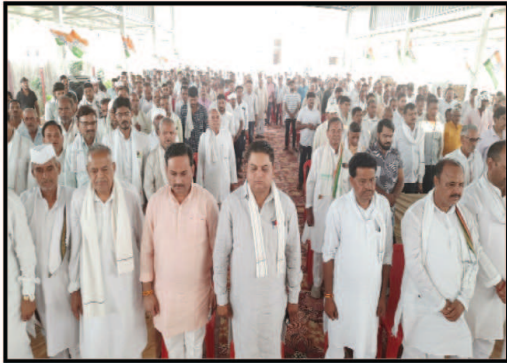
कार्यकर्ताओं की भागीदारी और स्थानीय मुद्दों पर संवाद हुआ। सभी प्रतिबद्धता जताई।