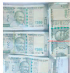
फुटेज खंगाली और मुखबिर तंत्र को सक्रिय किया। जांच में खुलासा हुआ कि वारदात में दुकान का पूर्व नाबालिग नौकर शामिल था, जिसने वर्तमान में काम करने वाले नाबालिग के जरिए जानकारी जुटाई और अपने तीन साथियों के साथ योजना बनाई।

भंवरकुआं थाना क्षेत्र में एक ऐसेसरीज दुकान से 2 लाख 80 हजार रुपये चोरी के मामले में पुलिस ने पूर्व नाबालिग नौकर और उसके तीन साथियों को गिरफ्तार किया है। आरोपियों ने योजनाबद्ध तरीके से ताला तोड़कर अलमारी से रुपये चुराए। पुलिस ने सीसीटीवी फुटेज और मुखबिर की सूचना पर चारों को धरदबोचा और 2 लाख 52 हजार रुपये की रकम बरामद कर ली। मामले में थाना प्रभारी राजकुमार यादव और उनकी टीम की सराहनीय भूमिका रही।