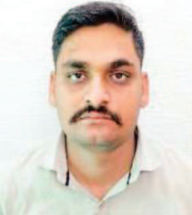
शिकायत क्रमांक 90/2019 के आधार पर जांच शुरू की और उसके बाद अपराध क्रमांक 138/2019 दर्ज कर भारतीय दंड संहिता की धारा 420 तथा आईटी एक्ट की धारा 66 सी और 66 डी के तहत मामला विवेचना में लिया गया।

इंदौर। राज्य सायबर सेल ने ऑनलाइन ठगी के एक पुराने मामले में बड़ी सफलता हासिल की है। फरियादी के आरबीएल बैंक क्रेडिट कार्ड से धोखाधड़ी कर निकाली गई 71,625 रुपये की पूरी राशि उसे वापस दिलाई गई है।